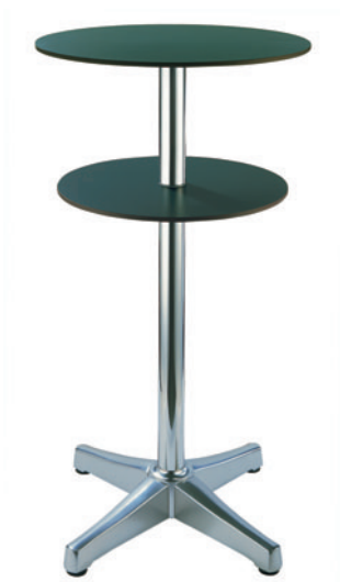
SEVILLA ALTA DOBLE